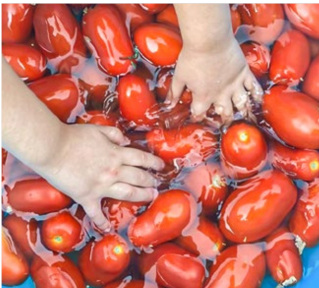
facciamo la passata