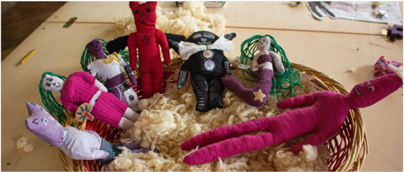
dallo straccio al pupazzo