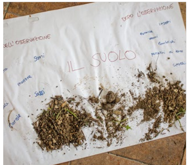
analisi del suolo