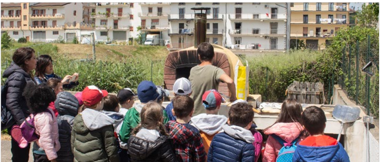
inforniamo il pane